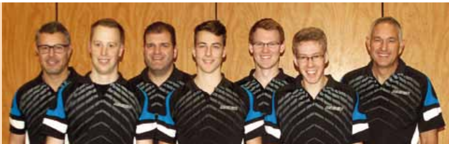
Die Spieler unserer aufgestiegenen Herren- mannschaft

Für die Tischtennispieler des TSV Weißenhorn war die vergangene Saison eine Spielzeit mit vielen Höhen und Tiefen.