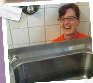
Kurz mal abtauchen!