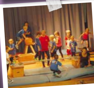
KISS ist spitze!