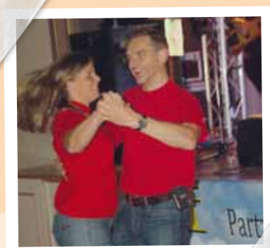
Mit viel Schwung