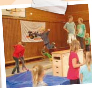
... und 1 flag, flag flag ...