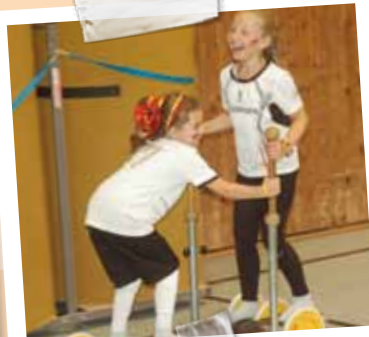
Wir sind Deutschland