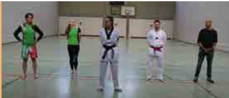
Der Kampfsporttag fand am 1.6.2022 in der Mittelschule in Weißenhorn statt.