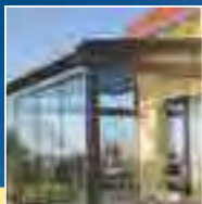
Terrassendächer & Carports