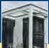
Jalousien & Rollläden