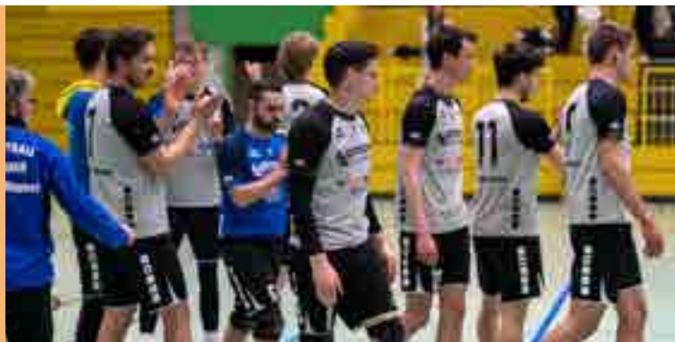
Die Herrenmannschaft im Wettkampfmodus

Sowohl die Herren- (Landesliga), als auch die Damenmannschaft (Bezirksklasse), wie auch die männliche U20 befinden sich bereits seit einigen Wochen mitten in der Vorbereitung auf die Saison 2022/2023.