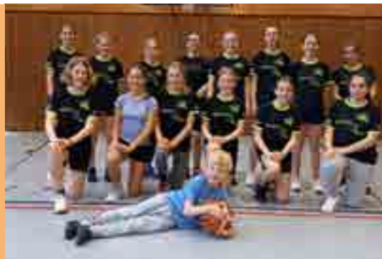
Bild oben: Flashmob am Kirchplatz Bild Mitte: Herrenteam Bild unten: Team nach dem 3x3-Turnier